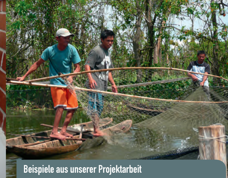
Beispiele aus unserer Projektarbeit